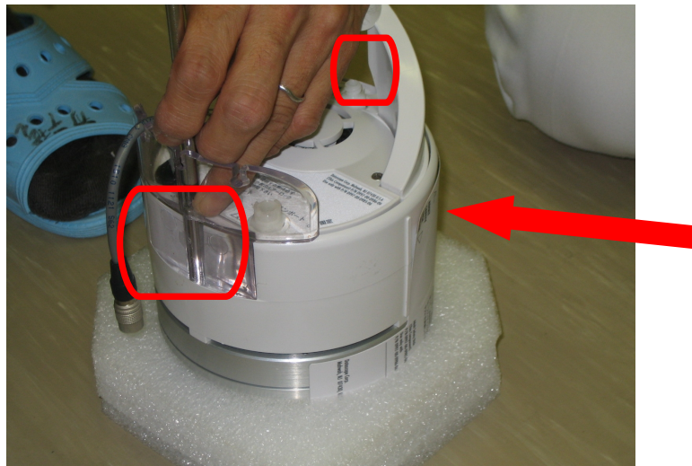
図 2 ネジの位置